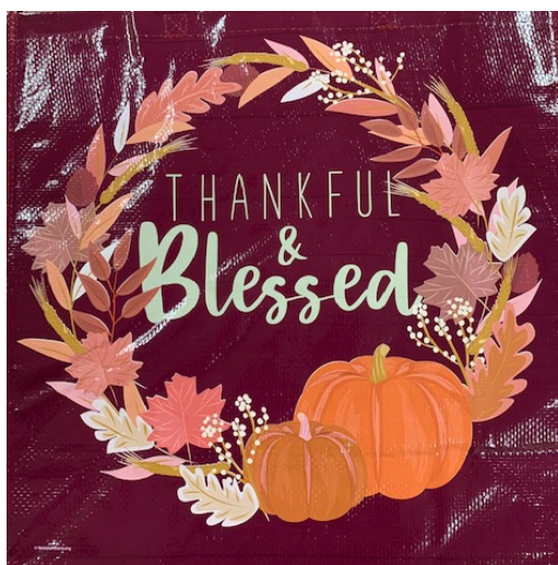
Actual Blessing Bag

Help BLESS our Parish Outreach guests' tables with your generous offerings.